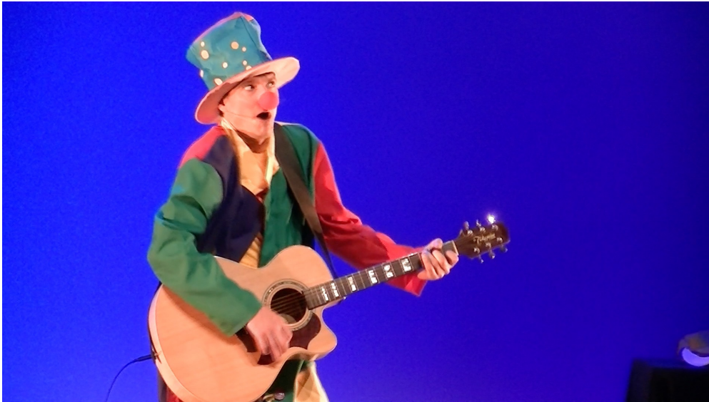
Au pays de la Tristesse avec Monsieur «Clown»