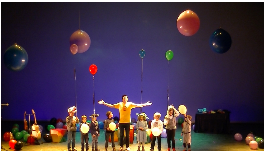
On a besoin de bonheur et de malheur pour faire un monde tout en couleurs