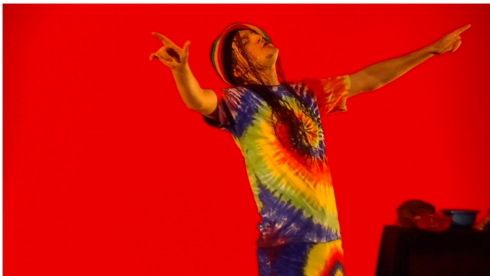
Au pays de la colère avec Monsieur «Cool»