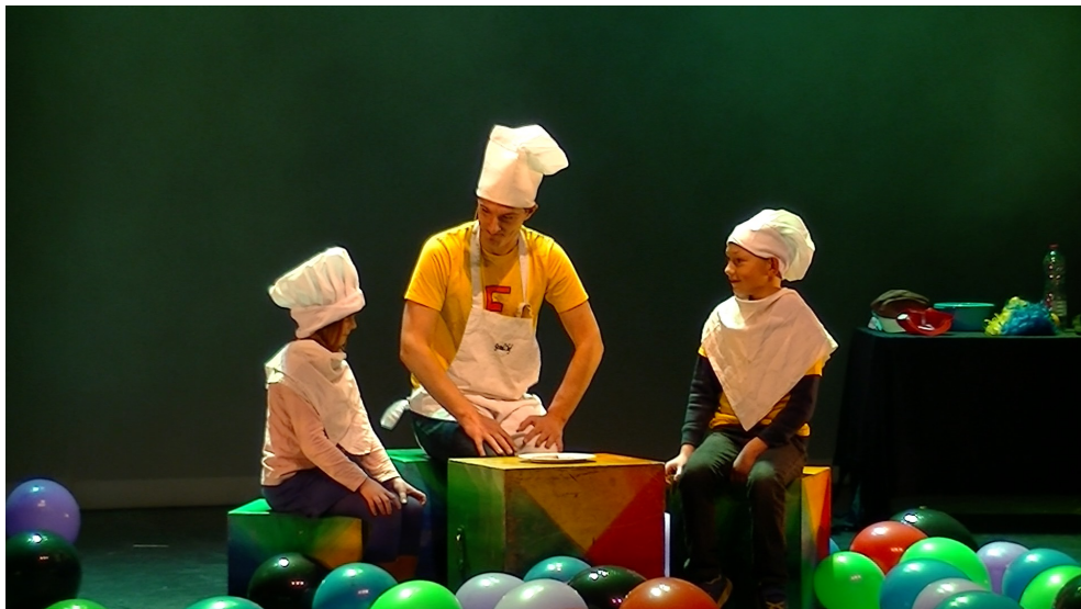
Au pays du Dégout avec Monsieur « Bon appétit »