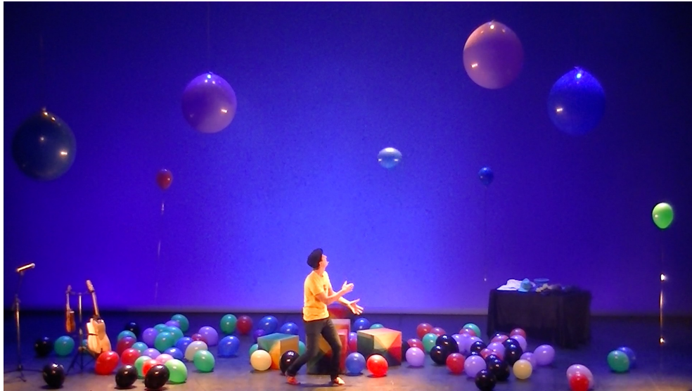
Tout en couleurs